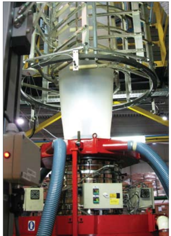
EcoCortecova visoka tehnologija u primjeni - proizvodnja biorazgradivih folija.

Tehnologija proizvodnje biorazgradive folije zaštićena je svjetskim patentima, proizvod tako postaje intelektualno vlasništvo koje je zaštićeno u čitavom svijetu, a u vlasništvu je Hrvatske kompanije.